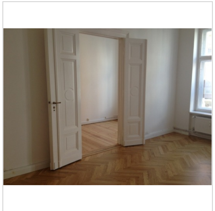
Büro mit Flügeltüren