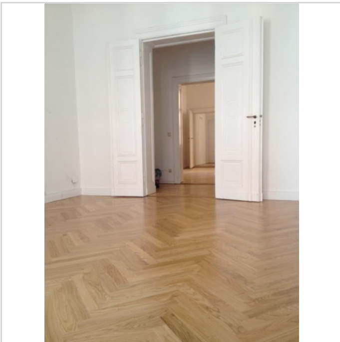
Grosses Büro mit Fischgrät