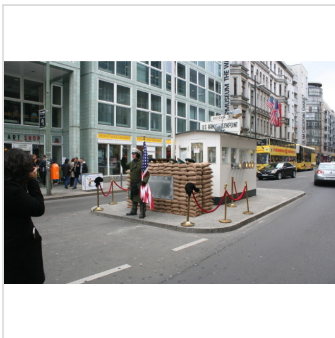
Checkpoint Charly um die Ecke