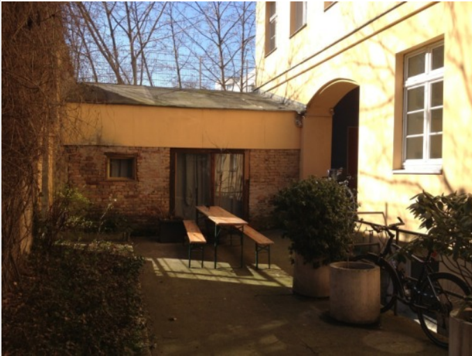
Pausenbereich im Hof